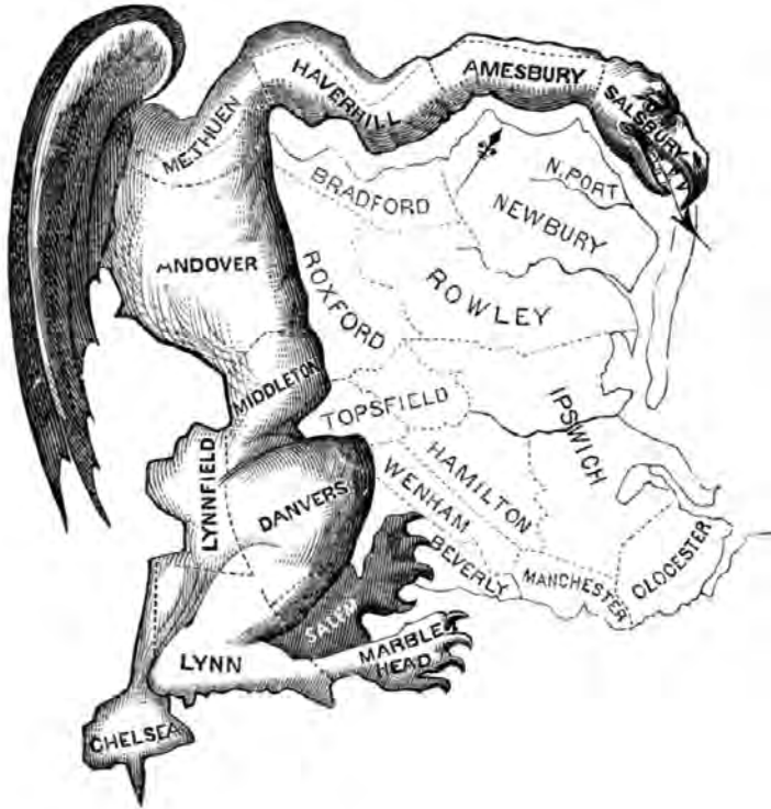
Джерримандер — подтасовка голосов по рецепту Джерри. Считается, что эту карикатуру нарисовал в 1812 году Элкана Тисдейл

лее коварный порок системы. Дело в том, что партия может проводить границы таким образом, чтобы гарантировать конкурирующей партии потерю необычно большой доли голосов. Возьмем Элбриджа Джерри и выборы в сенат. Когда массачусетские избиратели увидели карту избирательных округов, они не заметили почти ничего необычного. Однако один из округов заметно отличался от остальных. Он объединял 12 административных районов запада и севера штата и имел сложную форму. Политическому карикатуристу, автору рисунка, который вскоре появился в The